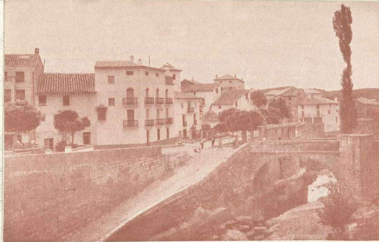
PUENTE VIEJO Y GLORIETA