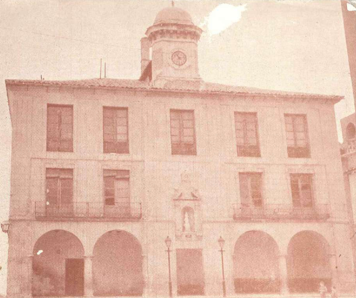
AYUNTAMIENTO DE MORA